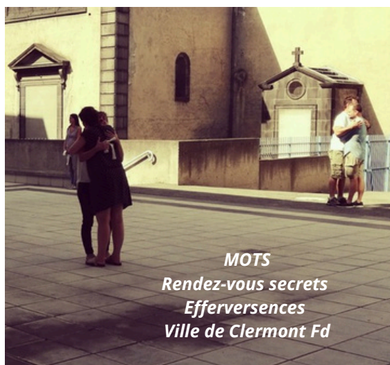
MOTS Rendez-vous secrets Efferversences Ville de Clermont Fd