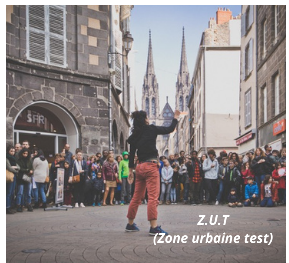
Z.U.T (Zone urbaine test)