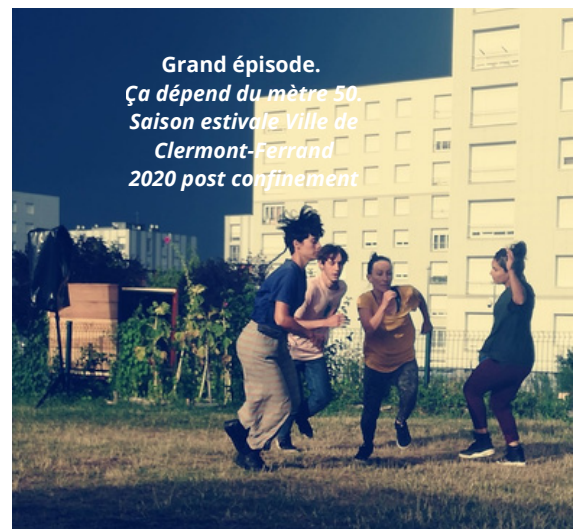
Grand épisode. Ça dépend du mètre 50. Saison estivale Ville de Clermont-Ferrand 2020 post confinement