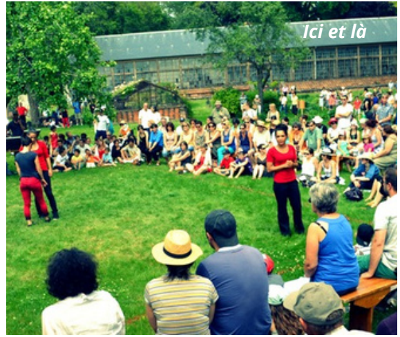
Ici et là