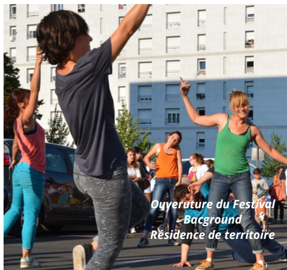
Ouverture du Festival - Bacground Résidence de territoire