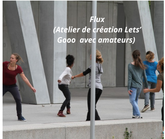
Flux (Atelier de création Lets' Gooo avec amateurs)