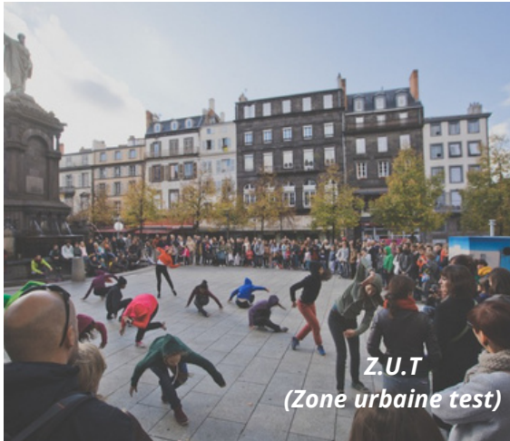
Z.U.T (Zone urbaine test)