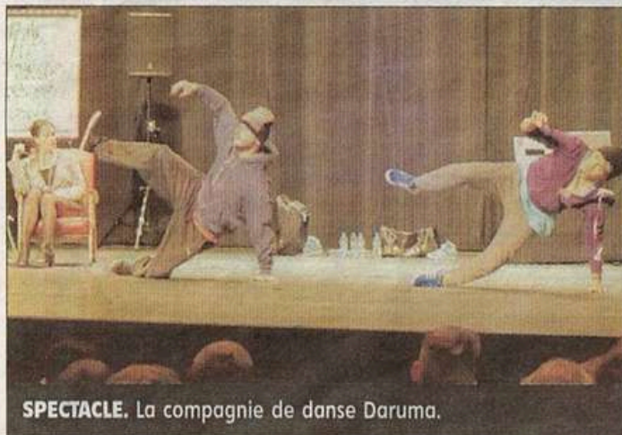
SPECTACLE. La compagnie de danse Daruma.

Près de 250 élèves de Châtel-Guyon, Laps et Pontgibaud sont venus au théâtre pour suivre la conférence dansée « Hip-hop or not » de la compagnie régionale Daruma.