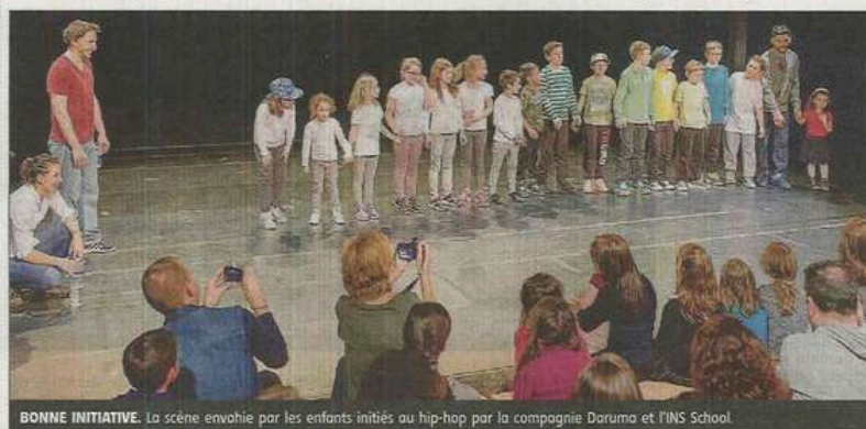
BONNE INITIATIVE. La scène envahie par les enfants initiés au hip-hop par la compagnie Daruma et l'INS School.

Le service Animation de la commune a innové en insérant dans sa programmation culturelle, un spectacle de danse, dimanche à l'espace culturel Les Justes.