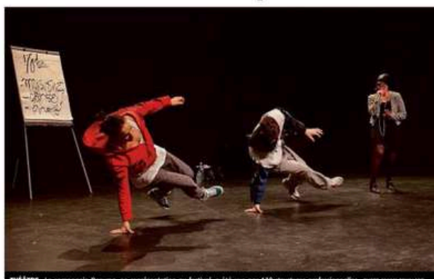
THÉÂTRE. La compagnie Daruma, en représentation au festival, a été vue par 130 structures professionnelles.

Exister au milieu de 1.500 autres spectacles